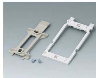
B1350048 Набор для настенного монтажа АБС (UL 94 HB) тепло-серый RAL 7032