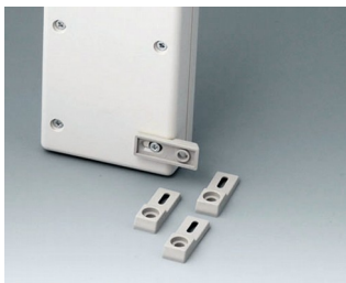
A9204108 Ушки для настенного монтажа ПА 6 тепло-серый RAL 7032