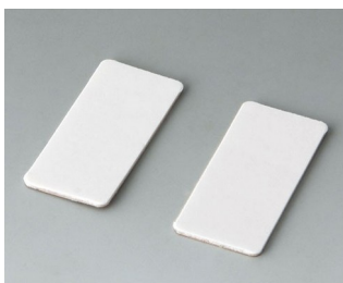
A9305147 Двусторонний скотч (2 полоски)

Возможно внесение изменений без предварительного уведомления. © by OKW Gehäusesysteme, Buchen/Germany.