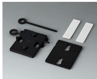
A9305019 Настенный держатель АСА+ПК (UL 94 V-0) черный RAL 9005