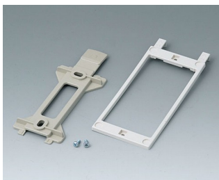
B1360048 Набор для настенного монтажа АБС (UL 94 HB) тепло-серый RAL 7032