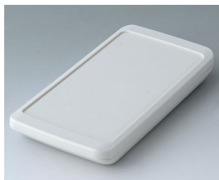
B5403307 SLIM-CASE M, исп. III ACA+ПК (UL 94 V-0) белый RAL 9002 148x74x19mm IP 65 opt., IP 40