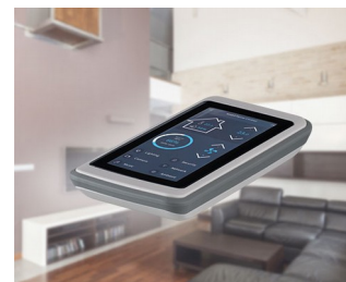
Smart Home Control