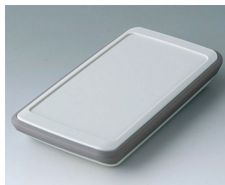
B5403317 SLIM-CASE M, исп. VI ACA+ПК (UL 94 V-0) белый RAL 9002 148x74x22mm IP 54