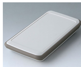
B5403217 SLIM-CASE M, исп. V ACA+ПК (UL 94 V-0) белый RAL 9002 148x74x22mm IP 54