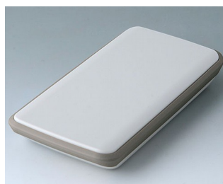
B5403117 SLIM-CASE M, исп. IV ACA+ПК (UL 94 V-0) белый RAL 9002 148x74x22mm IP 54