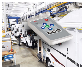
Remote control for interior design