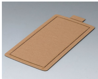
B5503300 Самоклеящаяся плёнка М