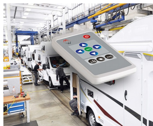
Remote control for interior design