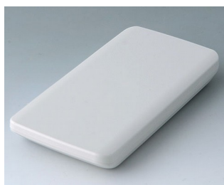
B5403107 SLIM-CASE M, исп. I ACA+ПК (UL 94 V-0) белый RAL 9002 148x74x19mm IP 65 opt., IP 40