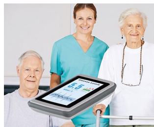
Sensor Checkup System / Monitoring