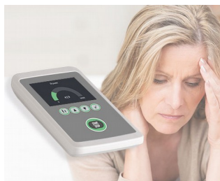
Biofeedback to reduce stress