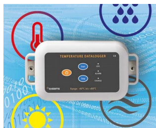
Data logger e.g. for temperature