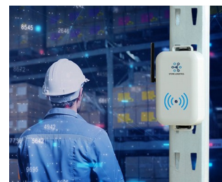
Smart store logistics