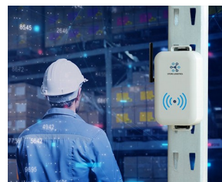
Smart store logistics