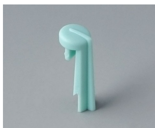
A1105005 Указатель «стрелка» ПА 6 (UL 94 HB) лагуна