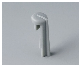
A1105007 Указатель «стрелка» ПА 6 (UL 94 HB) минерал