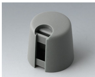
A1016648 Ручка TOP-KNOB 16 ПА 6 вулкан 16x16mm