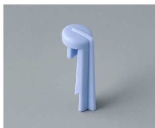
A1105006 Указатель «стрелка» ПА 6 (UL 94 HB) небо