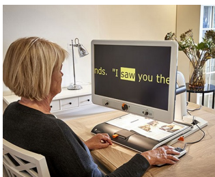
Control knobs for video magnifier