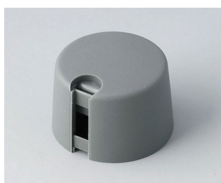
A1024648 Ручка TOP-KNOB 24 ПА 6 вулкан 24x16mm