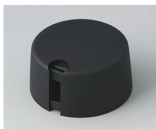
A1031649 Ручка TOP-KNOB 31 ПА 6 nero 31x16mm