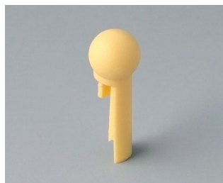
A1102004 Указатель «шарик» ПА 6 (UL 94 HB) пляж