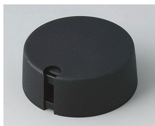
A1040649 Ручка TOP-KNOB 40 ПА 6 nero 40x16mm