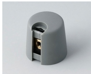
A1016068 Ручка TOP-KNOB 16 ПА 6 вулкан 16x16mm 6mm