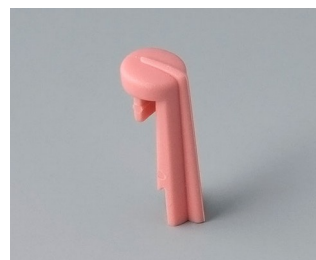
A1105003 Указатель «стрелка» ПА 6 (UL 94 HB) коралл