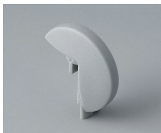
A1103007 Указатель «диск» ПА 6 (UL 94 HB) минерал