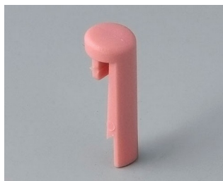
A1101003 Указатель «простой» ПА 6 (UL 94 HB) коралл