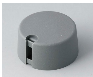
A1031648 Ручка TOP-KNOB 31 ПА 6 вулкан 31x16mm