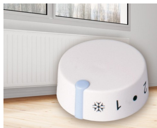
Integrated thermostat for electric storage heaters