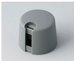
A1020648 Ручка TOP-KNOB 20 ПА 6 вулкан 20x16mm