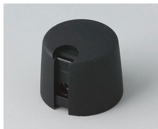
A1020649 Ручка TOP-KNOB 20 ПА 6 nero 20x16mm