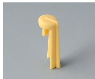
A1105004 Указатель «стрелка» ПА 6 (UL 94 HB) пляж