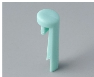
A1101005 Указатель «простой» ПА 6 (UL 94 HB) лагуна