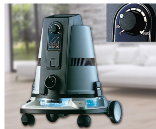
Operating element for a vacuum cleaner