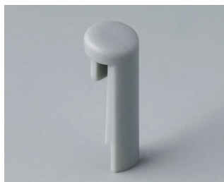
A1101007 Указатель «простой» ПА 6 (UL 94 HB) минерал