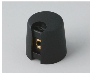
A1016049 Ручка TOP-KNOB 16 ПА 6 nero 16x16mm 4mm