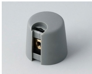
A1016048 Ручка TOP-KNOB 16 ПА 6 вулкан 16x16mm 4mm