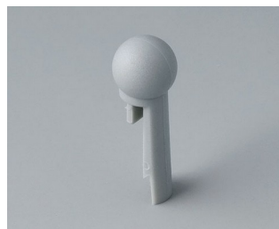
A1102007 Указатель «шарик» ПА 6 (UL 94 HB) минерал