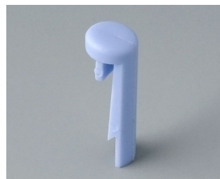
A1101006 Указатель «простой» ПА 6 (UL 94 HB) небо