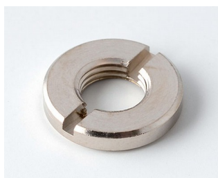
A6207009 Круглая гайка M7 x 0,75