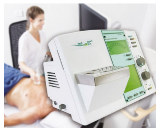
Operating element for a diagnostic device