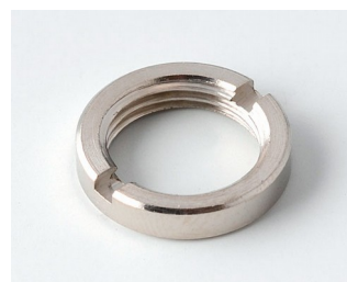
A6295009 Круглая гайка 3/8"-32G

Возможно внесение изменений без предварительного уведомления. © by OKW Gehäusesysteme, Buchen/Germany.