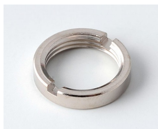
A6210009 Круглая гайка M10 x 0,75