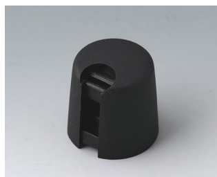
A1016649 Ручка TOP-KNOB 16 ПА 6 nero 16x16mm