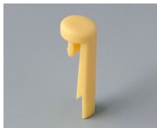
A1101004 Указатель «простой» ПА 6 (UL 94 HB) пляж