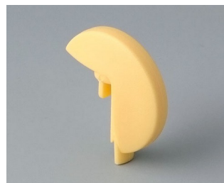
A1103004 Указатель «диск» ПА 6 (UL 94 HB) пляж