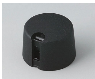
A1024649 Ручка TOP-KNOB 24 ПА 6 nero 24x16mm