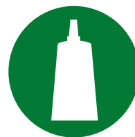
Установка / Сборка аксессуаров