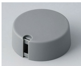
A1040648 Ручка TOP-KNOB 40 ПА 6 вулкан 40x16mm