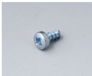
A0306031 Шуруп 3 x 6 мм (PZ1)