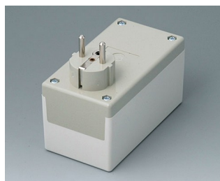
A9021665 PLUG CASE, исп. I ПК+АБС (UL 94 V-0) тепло-серый RAL 7032 120x65x65mm