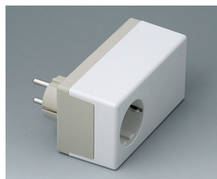
A9022465 PLUG CASE, исп. II ПК+АБС (UL 94 V-0) тепло-серый RAL 7032 120x65x55mm