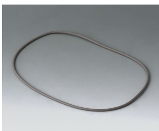
B4514030 Уплотнительная прокладка 140