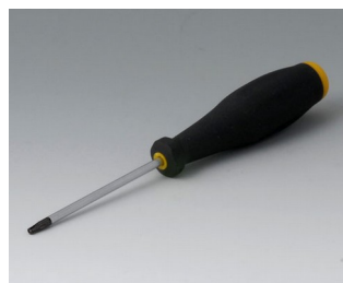
A0399T08 Отвёртка Torx T8