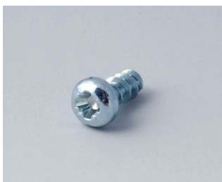
A0305031 Шуруп 2,5 x 6 мм (PZ1)