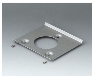
B4518101 Настенный держатель 180 Алюминий