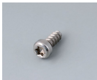
A0325060 Шуруп 2,5 x 6 мм (T8) нержавеющая сталь