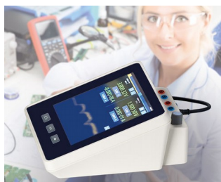
Multimeter measuring device