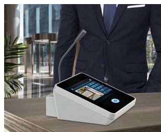
Table microphone / inter phone