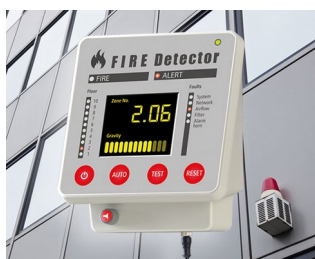
Terminal for fire alarm systems