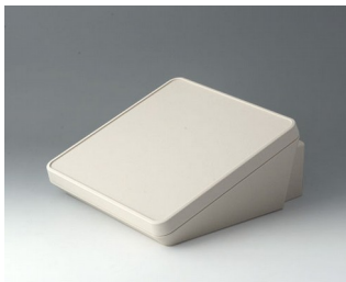
B4422307 PROTEC 220, исп. III ACA+ПК (UL 94 V-0) белый RAL 9002 220x243x108mm IP 65 opt.