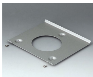
B4522101 Настенный держатель 220 Алюминий