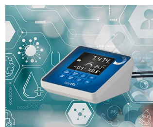
Laboratory measuring device