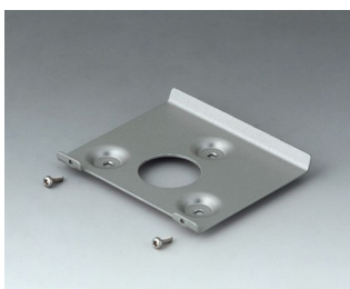
B4514101 Настенный держатель 140 Алюминий