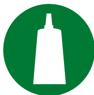
Установка / Сборка аксессуаров