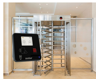
Terminal for access control