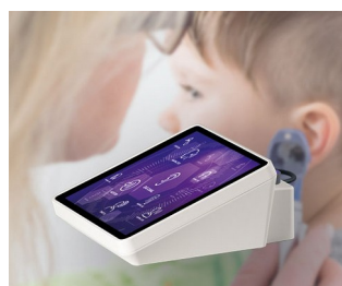
Hearing test device