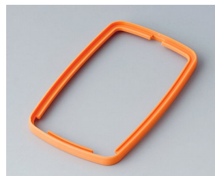
B9006783 Промежуточное кольцо EL TPE оранжевый