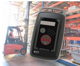
Mobile Security Solutions for workers