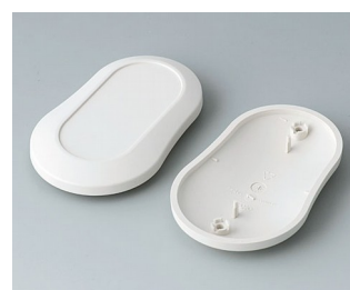
B9006907 Верхняя и нижняя части DL АБС (UL 94 HB) белый RAL 9002 84x53x19mm