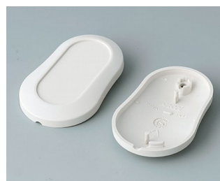
B9002907 Верхняя и нижняя части DS АБС (UL 94 HB) белый RAL 9002 51x32x13mm