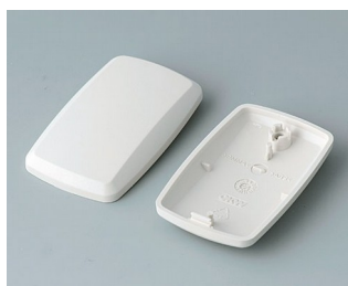
B9002857 Верхняя и нижняя части ES АБС (UL 94 HB) белый RAL 9002 52x32x15mm