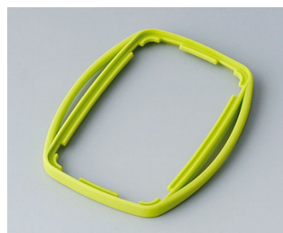
B9004754 Промежуточное кольцо EM ТРЕ зеленый