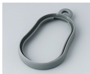
B9002358 Промежуточное кольцо DS ТРЕ вулкан