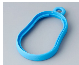
B9002355 Промежуточное кольцо DS ТРЕ синий