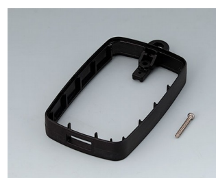
B9004796 Промежуточное кольцо EM, под разъем USB типа A ПММА (ИК) (UL 94 HB) черный RAL 9005