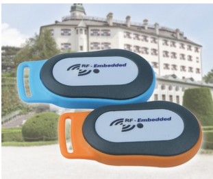
Mobile RFID information system