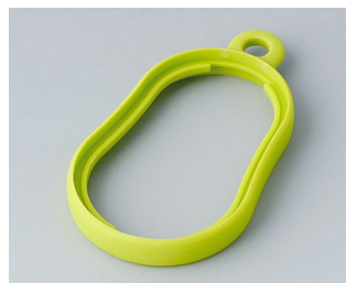
B9002354 Промежуточное кольцо DS ТРЕ зеленый