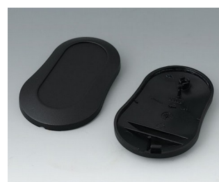
B9004906 Верхняя и нижняя части DM ПММА (ИК) (UL 94 HB) черный RAL 9005 70x44x16mm