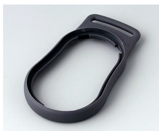
B9002302 Промежуточное кольцо DS TRE лава