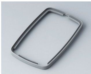
B9006788 Промежуточное кольцо EL TPE вулкан