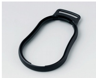
B9004306 Промежуточное кольцо DM ПММА (ИК) (UL 94 HB) черный RAL 9005