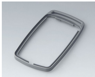
B9006708 Промежуточное кольцо EL TPE вулкан