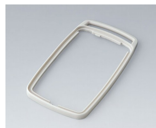
B9006707 Промежуточное кольцо EL СЭБС (ТПЭ) белый RAL 9002