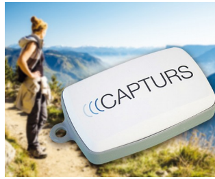
GPS tracking in real time