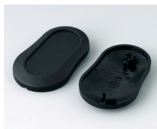
B9002906 Верхняя и нижняя части DS ПММА (ИК) (UL 94 HB) черный RAL 9005 51x32x13mm