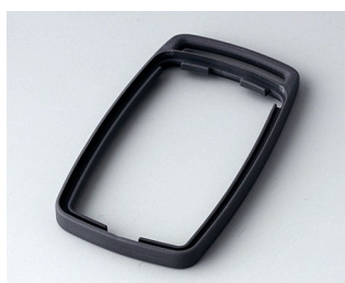
B9002702 Промежуточное кольцо ES ТРЕ лава