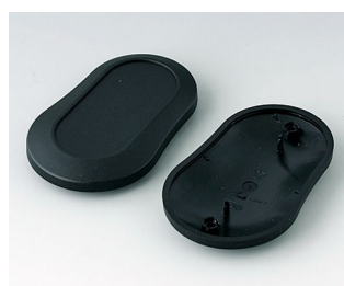
B9006906 Верхняя и нижняя части DL ПММА (ИК) (UL 94 HB) черный RAL 9005 84x53x19mm