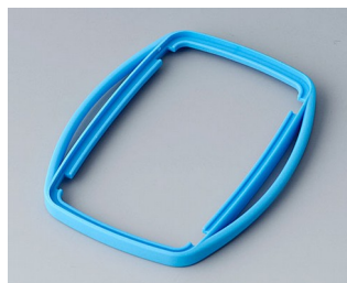
B9006755 Промежуточное кольцо EL TPE синий