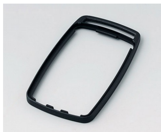
B9004706 Промежуточное кольцо EM ПММА (ИК) (UL 94 HB) черный RAL 9005