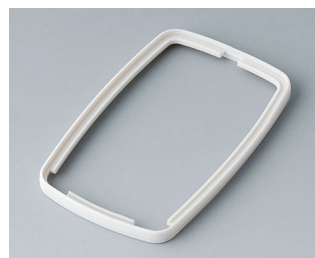
B9006787 Промежуточное кольцо EL СЭБС (ТПЭ) белый RAL 9002