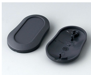
B9002908 Верхняя и нижняя части DS АБС (UL 94 HB) лава 51x32x13mm