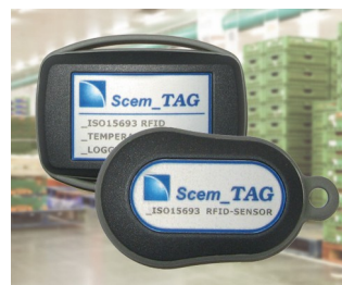
RFID sensor transponder and data logger