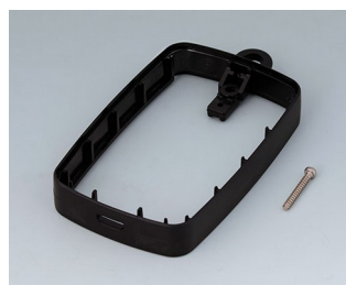
B9004779 Промежуточное кольцо EM, под разъем Micro USB АБС (UL 94 HB) черный RAL 9005