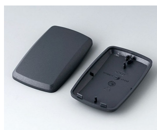
B9004858 Верхняя и нижняя части EM АБС (UL 94 HB) лава 68x42x18mm