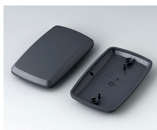
B9006858 Верхняя и нижняя части EL АБС (UL 94 HB) лава 78x48x20mm