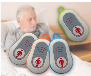
Radio paging systems