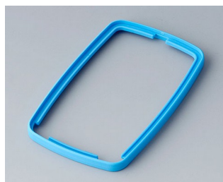
B9006785 Промежуточное кольцо EL TPE синий