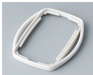
B9002757 Промежуточное кольцо ES TPE белый RAL 9002