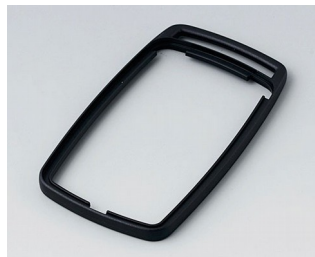
B9006709 Промежуточное кольцо EL АБС (UL 94 HB) черный RAL 9005