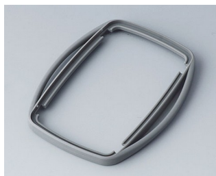
B9006758 Промежуточное кольцо EL TPE вулкан