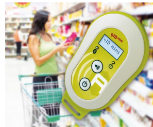
Mobile UHF RFID scanner