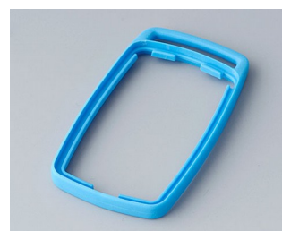
B9002705 Промежуточное кольцо ES ТРЕ синий