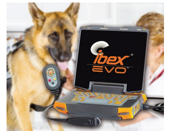
Portable ultrasonic device for veterinary medicine