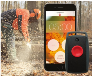
A personal alarm on your mobile phone