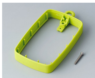
B9004784 Промежуточное кольцо EM, высокое СЭБС (ТПЭ) зеленый