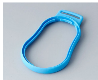
B9004305 Промежуточное кольцо DM TPE синий