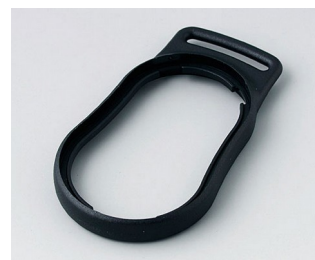
B9002309 Промежуточное кольцо DS АБС (UL 94 HB) черный RAL 9005