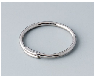
A9164001 Кольцо для ключей Сталь никелированный 20,5mm