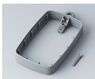
B9004788 Промежуточное кольцо EM, высокое ТРЕ вулкан