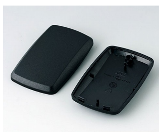
B9004856 Верхняя и нижняя части EM ПММА (ИК) (UL 94 HB) черный RAL 9005 68x42x18mm