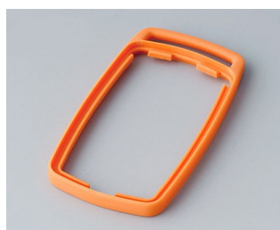
B9002703 Промежуточное кольцо ES ТРЕ оранжевый