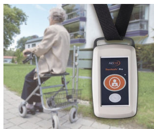
Radio transmitter for emergency call system for patients