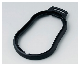
B9006309 Промежуточное кольцо DL АБС (UL 94 HB) черный RAL 9005