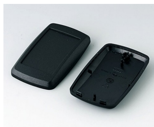
B9004806 Верхняя и нижняя части EM ПММА (ИК) (UL 94 HB) черный RAL 9005 68x42x18mm