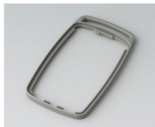
B9004708 Промежуточное кольцо EM ТРЕ вулкан