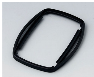
B9006756 Промежуточное кольцо EL ПММА (ИК) (UL 94 HB) черный RAL 9005