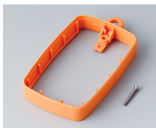
B9004783 Промежуточное кольцо EM, высокое ТРЕ оранжевый