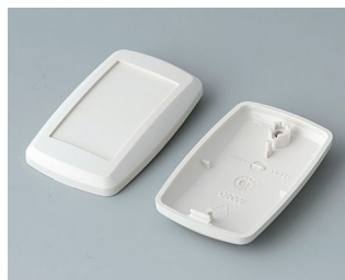
B9002807 Верхняя и нижняя части ES АБС (UL 94 HB) белый RAL 9002 52x32x15mm