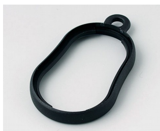
B9002356 Промежуточное кольцо DS ПММА (ИК) (UL 94 HB) черный RAL 9005