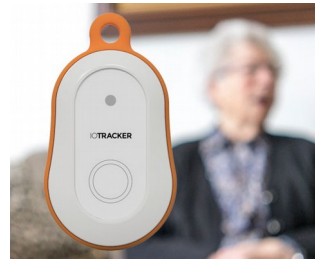
LoRa GPS tracker with alarm button