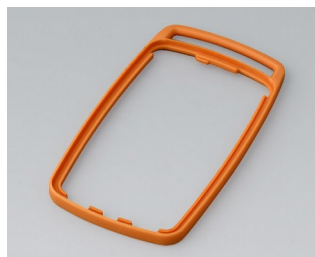
B9004703 Промежуточное кольцо EM ТРЕ оранжевый