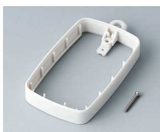
B9004787 Промежуточное кольцо EM, высокое СЭБС (ТПЭ) белый RAL 9002