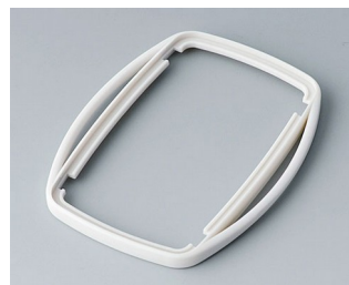
B9006757 Промежуточное кольцо EL СЭБС (ТПЭ) белый RAL 9002