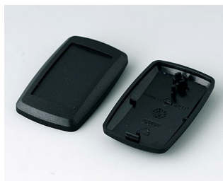
B9002806 Верхняя и нижняя части ES ПММА (ИК) (UL 94 HB) черный RAL 9005 52x32x15mm