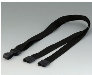
B9100073 Ремешок для ношения черный 914x16mm