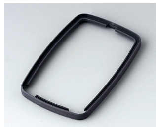
B9006782 Промежуточное кольцо EL СЭБС (ТПЭ) лава