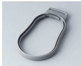
B9004308 Промежуточное кольцо DM ТРЕ вулкан