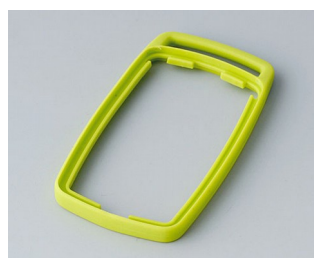
B9002704 Промежуточное кольцо ES ТРЕ зеленый