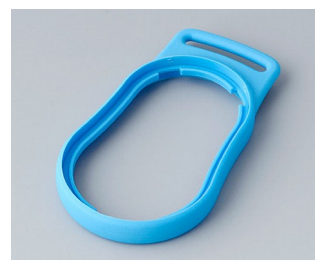
B9002305 Промежуточное кольцо DS TRE синий