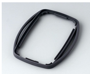
B9004752 Промежуточное кольцо EM ТРЕ лава