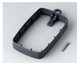
B9004782 Промежуточное кольцо EM, высокое СЭБС (ТПЭ) лава