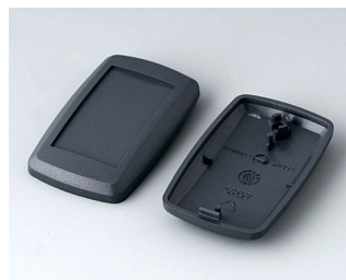
B9002808 Верхняя и нижняя части ES АБС (UL 94 HB) лава 52x32x15mm