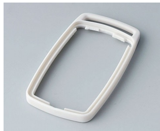
B9002707 Промежуточное кольцо ES TPE белый RAL 9002