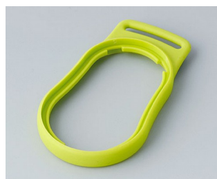
B9002304 Промежуточное кольцо DS СЭБС (ТПЭ) зеленый