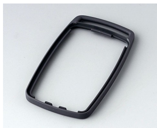
B9004702 Промежуточное кольцо EM ТРЕ лава