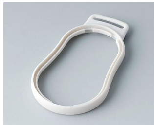
B9004307 Промежуточное кольцо DM СЭБС (ТПЭ) белый RAL 9002