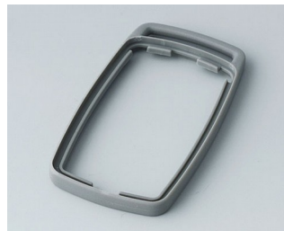
B9002708 Промежуточное кольцо ES TPE вулкан