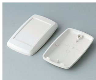
B9004807 Верхняя и нижняя части EM АБС (UL 94 HB) белый RAL 9002 68x42x18mm