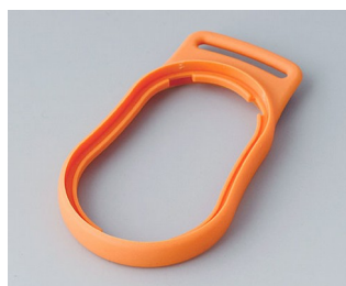
B9002303 Промежуточное кольцо DS СЭБС (ТПЭ) оранжевый