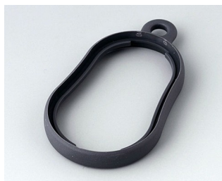
B9002352 Промежуточное кольцо DS ТРЕ лава