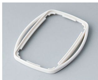
B9004757 Промежуточное кольцо EM СЭБС (ТПЭ) белый RAL 9002