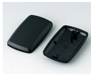
B9002856 Верхняя и нижняя части ES ПММА (ИК) (UL 94 HB) черный RAL 9005 52x32x15mm