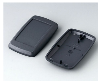
B9004808 Верхняя и нижняя части EM АБС (UL 94 HB) лава 68x42x18mm