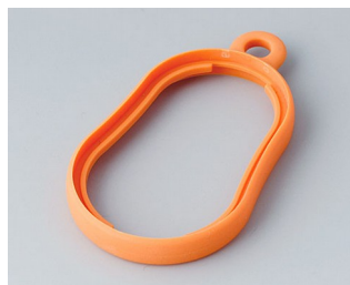
B9002353 Промежуточное кольцо DS ТРЕ оранжевый