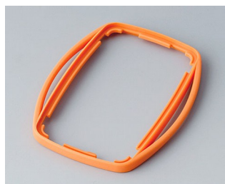
B9004753 Промежуточное кольцо EM СЭБС (ТПЭ) оранжевый