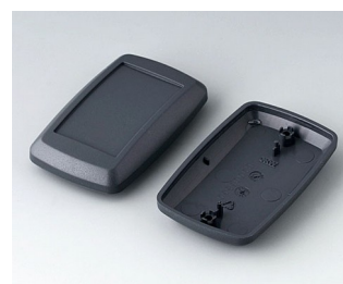
B9006818 Верхняя и нижняя части EL АБС (UL 94 HB) лава 78x48x24mm