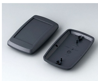
B9006808 Верхняя и нижняя части EL АБС (UL 94 HB) лава 78x48x20mm