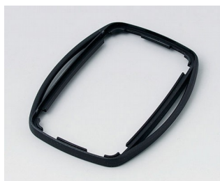
B9004756 Промежуточное кольцо EM ПММА (ИК) (UL 94 HB) черный RAL 9005