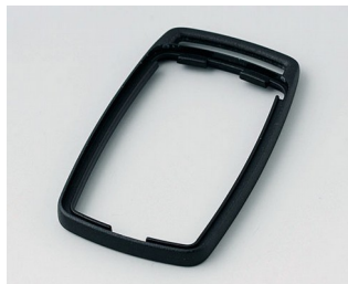
B9002706 Промежуточное кольцо ES ПММА (ИК) (UL 94 HB) черный RAL 9005