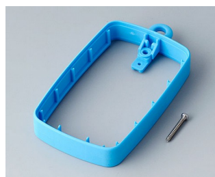
B9004785 Промежуточное кольцо EM, высокое ТРЕ синий