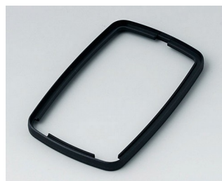
B9006786 Промежуточное кольцо EL ПММА (ИК) (UL 94 HB) черный RAL 9005