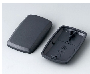
B9002858 Верхняя и нижняя части ES АБС (UL 94 HB) лава 52x32x15mm