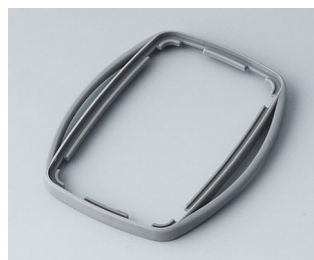
B9004758 Промежуточное кольцо EM ТРЕ вулкан