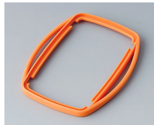
B9006753 Промежуточное кольцо EL TPE оранжевый