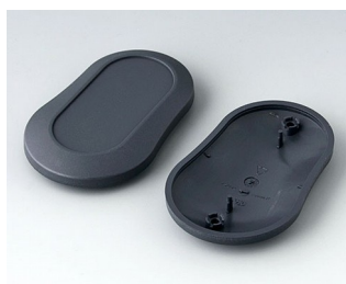
B9006908 Верхняя и нижняя части DL АБС (UL 94 HB) лава 84x53x19mm