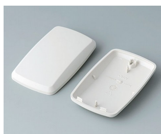
B9004857 Верхняя и нижняя части EM АБС (UL 94 HB) белый RAL 9002 68x42x18mm