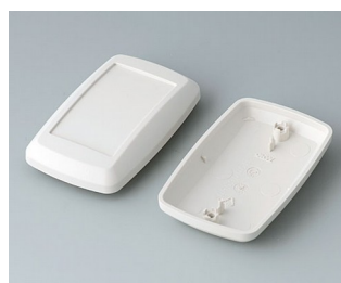
B9006817 Верхняя и нижняя части EL АБС (UL 94 HB) белый RAL 9002 78x48x24mm