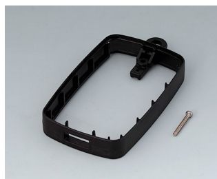
B9004799 Промежуточное кольцо EM, под разъем USB типа A АБС (UL 94 HB) черный RAL 9005