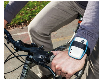
Mobile air quality monitoring