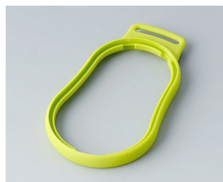
B9004304 Промежуточное кольцо DM TPE зеленый