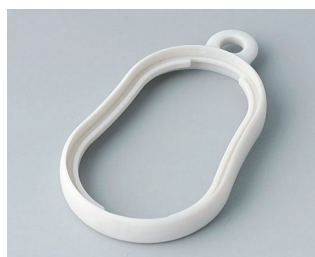
B9002357 Промежуточное кольцо DS СЭБС (ТПЭ) белый RAL 9002