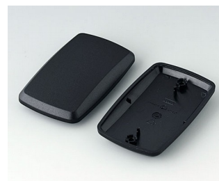
B9006856 Верхняя и нижняя части EL ПММА (ИК) (UL 94 HB) черный RAL 9005 78x48x20mm