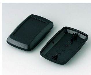
B9006816 Верхняя и нижняя части EL ПММА (ИК) (UL 94 HB) черный RAL 9005 78x48x24mm