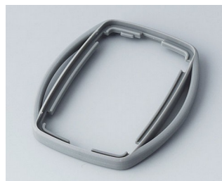
B9002758 Промежуточное кольцо ES TPE вулкан