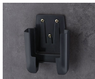
A9106628 Настенный держатель M ACA+ПК (UL 94 V-0) лава