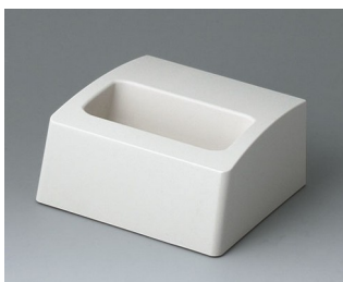
A9105507 База S ACA+ПК (UL 94 V-0) белый RAL 9002