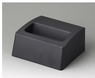
A9105508 База S ACA+ПК (UL 94 V-0) лава