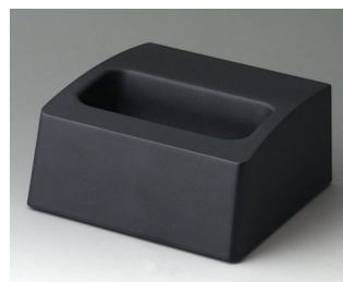
A9106508 База M ACA+ПК (UL 94 V-0) лава