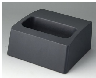
A9107508 База L ACA+ПК (UL 94 V-0) лава