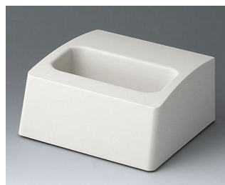
A9106507 База M ACA+ПК (UL 94 V-0) белый RAL 9002