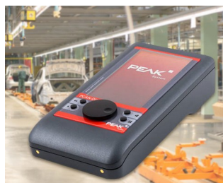
Mobile diagnostic device for CAN and CAN FD buses