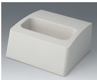
A9107507 База L ACA+ПК (UL 94 V-0) белый RAL 9002