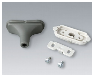
B2911328 Набор для ввода кабеля, 5,0 - 5,9 TPE вулкан