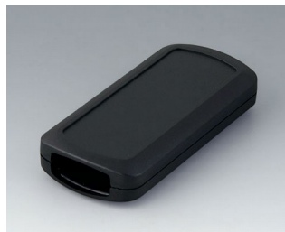
B2833109 CONNECT M ACA+ПК (UL 94 V-0) черный RAL 9005 116x54x22mm