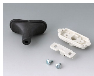
B2911309 Набор для ввода кабеля, 3,4 - 4,2 TPE черный RAL 9005