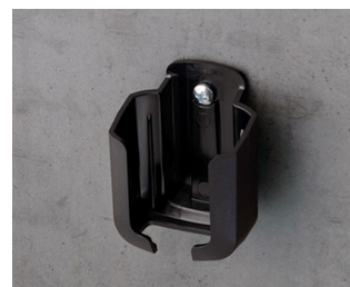
B2921509 Настенный держатель S ACA+ПК (UL 94 V-0) черный RAL 9005