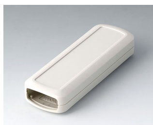
B2824107 CONNECT S ACA+ПК (UL 94 V-0) белый RAL 9002 120x42x22mm