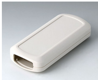
B2833107 CONNECT M ACA+ПК (UL 94 V-0) белый RAL 9002 116x54x22mm