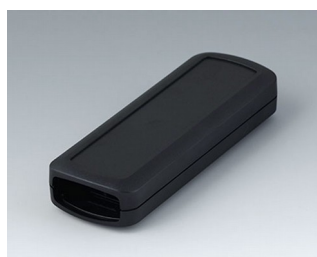
B2824109 CONNECT S ACA+ПК (UL 94 V-0) черный RAL 9005 120x42x22mm