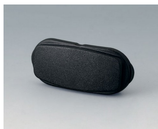
B2811209 Торцевая панель ACA+ПК (UL 94 V-0) черный RAL 9005