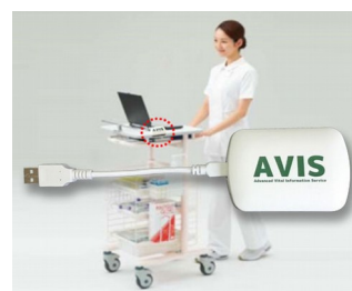
Receiver and data transfer for EMR