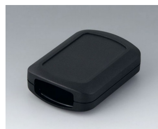
B2832109 CONNECT M ACA+ПК (UL 94 V-0) черный RAL 9005 76x54x22mm