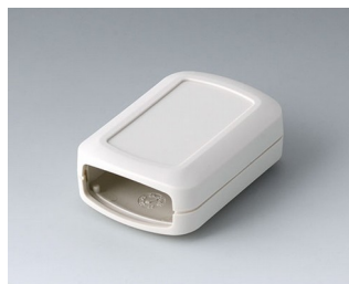
B2822107 CONNECT S ACA+ПК (UL 94 V-0) белый RAL 9002 60x42x22mm