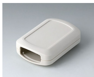
B2832107 CONNECT M ACA+ПК (UL 94 V-0) белый RAL 9002 76x54x22mm