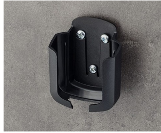
B2931509 Настенный держатель М АСА+ПК (UL 94 V-0) черный RAL 9005