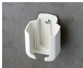
B2921507 Настенный держатель S ACA+ПК (UL 94 V-0) белый RAL 9002