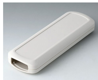
B2834107 CONNECT M ACA+ПК (UL 94 V-0) белый RAL 9002 156x54x22mm