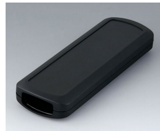
B2834109 CONNECT M ACA+ПК (UL 94 V-0) черный RAL 9005 156x54x22mm