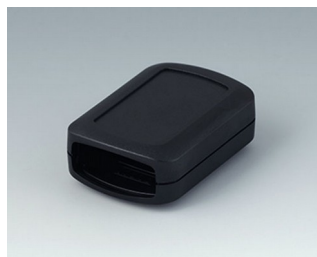
B2822109 CONNECT S ACA+ПК (UL 94 V-0) черный RAL 9005 60x42x22mm