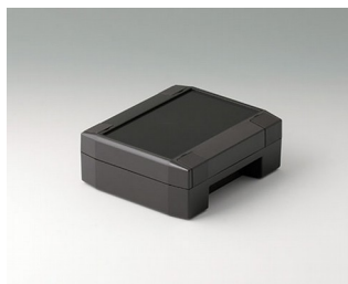
C8011131 SOLID-BOX 115 ПК+АБС (UL 94 V-0) тёмно-серый RAL 7016 135x115x50mm IP 66, IP 67, IK 08