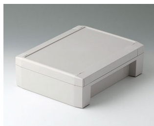
C8017222 SOLID-BOX 175 ПК+АБС (UL 94 V-0) светло-серый RAL 7035 225x175x70mm IP 66, IP 67, IK 08