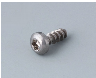
A0308132 Шуруп 3 x 8 мм (Т10) нержавеющая сталь