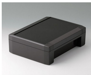
C8017221 SOLID-BOX 175 ПК+АБС (UL 94 V-0) тёмно-серый RAL 7016 225x175x70mm IP 66, IP 67, IK 08