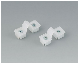
C2299031 Внутренние петли ПП естественная окраска