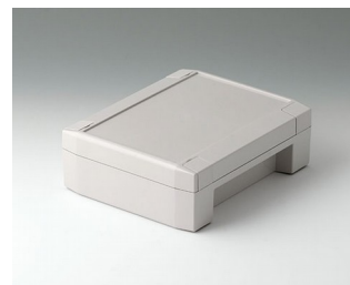
C8014182 SOLID-BOX 145 ПК+АБС (UL 94 V-0) светло-серый RAL 7035 180x145x60mm IP 66, IP 67, IK 08