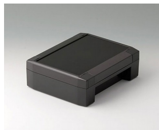
C8014181 SOLID-BOX 145 ПК+АБС (UL 94 V-0) тёмно-серый RAL 7016 180x145x60mm IP 66, IP 67, IK 08