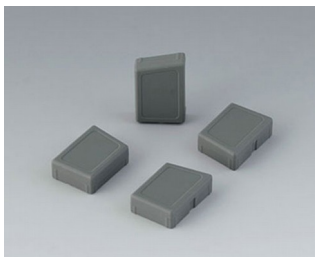
C8100188 Набор ножек СЭБС (ТПЭ) вулкан

Возможно внесение изменений без предварительного уведомления.