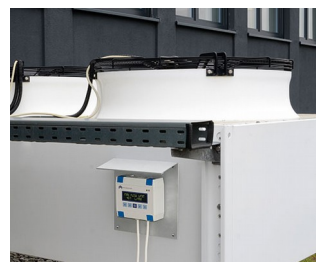
Heating/air conditioning/ventilation control