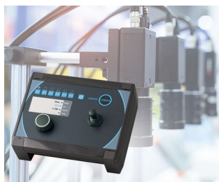
Camera control in production