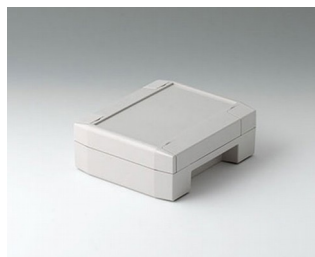
C8011132 SOLID-BOX 115 ПК+АБС (UL 94 V-0) светло-серый RAL 7035 135x115x50mm IP 66, IP 67, IK 08