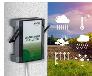
Weather station in agriculture