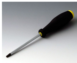
A0399T20 Отвёртка Torx T20