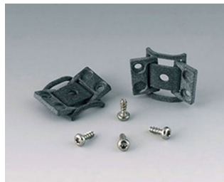
C8100360 Набор петель