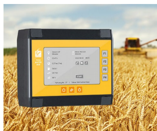
Data recording for harvesters