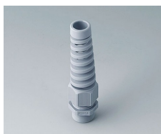
C2320518 Кабельный ввод M20 x 1,5, с защитой от изгиба ПА серебристо-серый RAL 7001