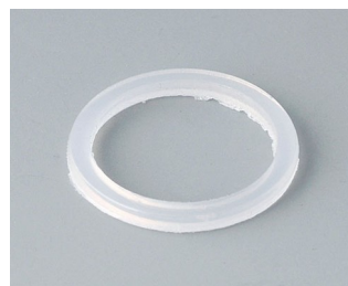
C2316126 Уплотнительное кольцо для кабельного ввода M16 ПЭ естественная окраска