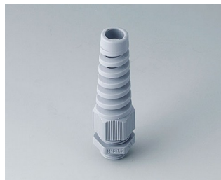
C2316518 Кабельный ввод M16 x 1,5, с защитой от изгиба ПА серебристо-серый RAL 7001 IP 68