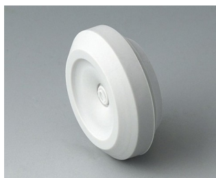
C2320147 Кабельная манжета ТПЭ светло-серый RAL 7035