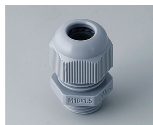
C2316418 Кабельный ввод M16 x 1,5 ПА серебристо-серый RAL 7001 IP 68