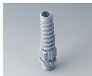
C2320528 Кабельный ввод M20 x 1,5, с защитой от изгиба ПА серебристо-серый RAL 7001