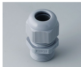
C2320418 Кабельный ввод M20 x 1,5 ПА серебристо-серый RAL 7001