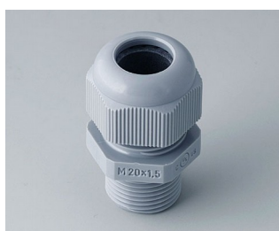
C2320428 Кабельный ввод M20 x 1,5 ПА серебристо-серый RAL 7001