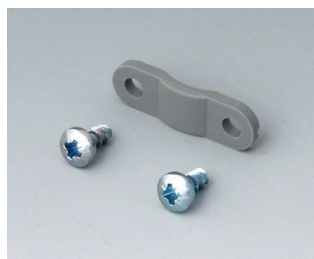
A9199005 Кабельный прижим ПА 6 вулкан