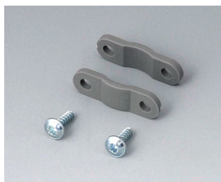
A9166004 Кабельный прижим ПА 6 вулкан