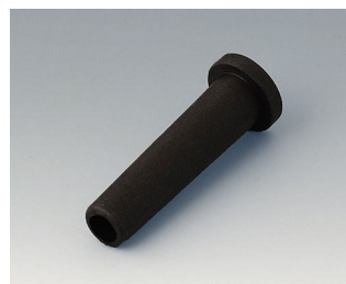
C2353849 Гибкая кабельная манжета Ø 5,3