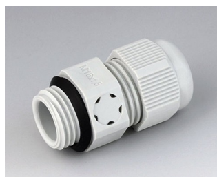
C2316917 Кабельный ввод M16x1,5, с компенсацией давления ПА светло-серый RAL 7035 IP 68