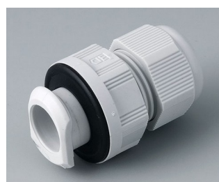
C2320717 Кабельный ввод для быстрой установки, M20 ПА светло-серый RAL 7035