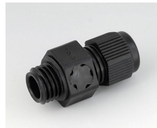
C2312919 Кабельный ввод M12x1,5, с компенсацией давления ПА черный RAL 9005 IP 68