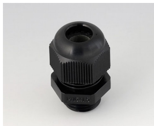
C2316419 Кабельный ввод M16 x 1,5 ПА черный RAL 9005 IP 68