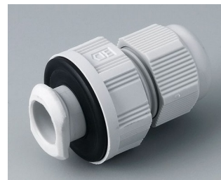
C2316717 Кабельный ввод для быстрой установки, M16 ПА светло-серый RAL 7035 IP 68