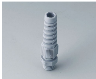
C2312518 Кабельный ввод M12 x 1,5, с защитой от изгиба ПА серебристо-серый RAL 7001 IP 68