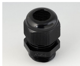
C2320419 Кабельный ввод M20 x 1,5 ПА черный RAL 9005