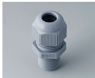
C2316618 Кабельный ввод M16 x 1,5 ПА серебристо-серый RAL 7001 IP 68