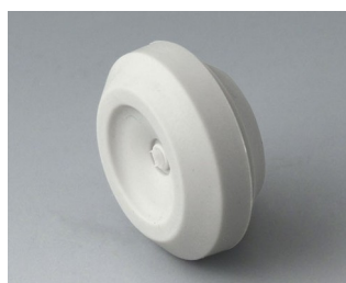
C2316147 Кабельная манжета ТПЭ светло-серый RAL 7035 IP 67