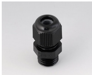
C2312419 Кабельный ввод M12 x 1,5 ПА черный RAL 9005 IP 68