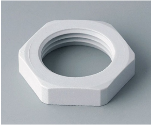
C2320117 Контргайка M20 x 1,5 ПА светло-серый RAL 7035