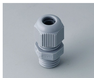
C2312418 Кабельный ввод M12 x 1,5 ПА серебристо-серый RAL 7001