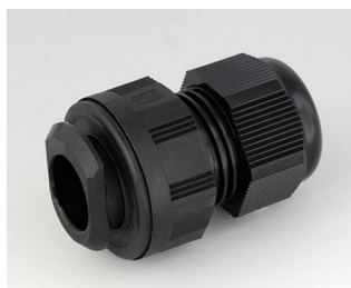
C2320719 Кабельный ввод для быстрой установки, M20 ПА черный RAL 9005