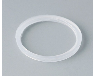
C2320126 Уплотнительное кольцо для кабельного ввода M20 ПЭ естественная окраска

Возможно внесение изменений без предварительного уведомления. © by OKW Gehäusesysteme, Buchen/Germany.