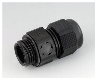
C2316919 Кабельный ввод M16x1,5, с компенсацией давления ПА черный RAL 9005 IP 68