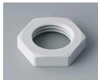
C2316117 Контргайка M16 x 1,5 ПА светло-серый RAL 7035