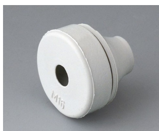
C2316137 Кабельная манжета EPDM светло-серый RAL 7035 IP 67