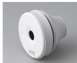
C2320137 Кабельная манжета EPDM светло-серый RAL 7035 IP 67