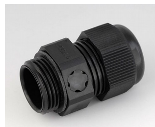
C2320919 Кабельный ввод M20x1,5, с компенсацией давления ПА черный RAL 9005