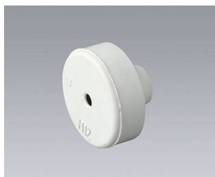
C2312137 Кабельная манжета EPDM светло-серый RAL 7035 IP 67