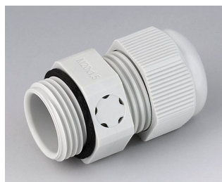
C2320917 Кабельный ввод M20x1,5, с компенсацией давления ПА светло-серый RAL 7035