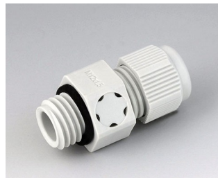
C2312917 Кабельный ввод M12x1,5, с компенсацией давления ПА светло-серый RAL 7035 IP 68