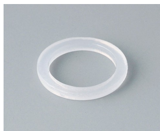
C2312126 Уплотнительное кольцо для кабельного ввода M12 ПЭ естественная окраска