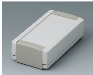
B1040365 TOPTEC 102, исп. I АБС (UL 94 HB) белый RAL 9002 102x54x30mm IP 40