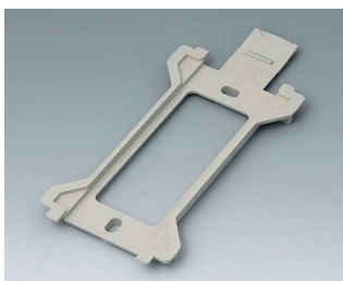
B1370028 Настенный держатель для TOPTEC 194 ПК+АБС (UL 94 V-0) тепло-серый RAL 7032