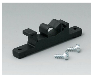
B1300019 Адаптер для монтажа на DIN-рейку ПА 6 черный RAL 9005