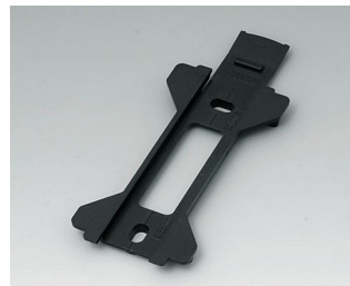
B1360029 Настенный держатель для TOPTEC 154 АБС (UL 94 HB) черный RAL 9005