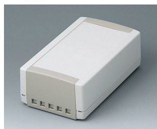
B1070465 TOPTEC 194 H, исп. II АБС (UL 94 HB) белый RAL 9002 194x115x68mm IP 40