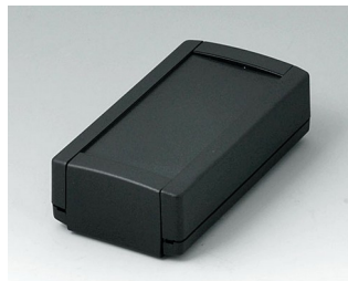
B1040369 TOPTEC 102, исп. I АБС (UL 94 HB) черный RAL 9005 102x54x30mm IP 40