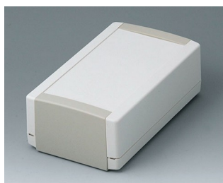
B1070365 TOPTEC 194 H, исп. I АБС (UL 94 HB) белый RAL 9002 194x115x68mm IP 40