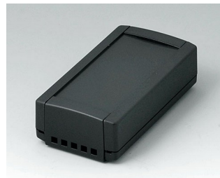
B1040469 TOPTEC 102, исп. II АБС (UL 94 HB) черный RAL 9005 102x54x30mm IP 40