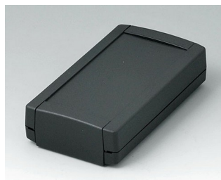
B1055369 TOPTEC 123 F, исп. I АБС (UL 94 HB) черный RAL 9005 123x68x30mm IP 40