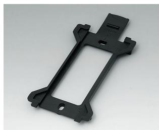
B1370029 Настенный держатель для TOPTEC 194 АБС (UL 94 HB) черный RAL 9005