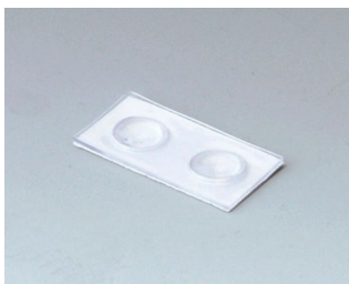
A9207150 Резиновые ножки 6,5 x 2 мм прозрачный

Возможно внесение изменений без предварительного уведомления. © by OKW Gehäusesysteme, Buchen/Germany.