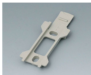
B1340028 Настенный держатель для TOPTEC 102 ПК+АБС (UL 94 V-0) тепло-серый RAL 7032