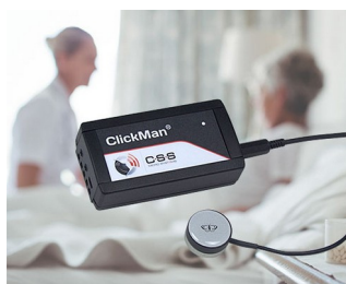
Adaptive multicontroller for single sensors