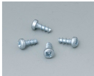
A9199008 Набор шурупов