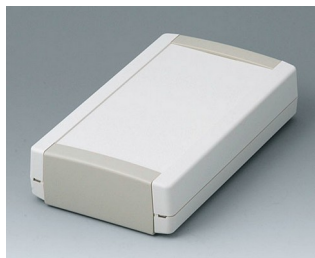
B1075365 TOPTEC 194 F, исп. I АБС (UL 94 HB) белый RAL 9002 194x115x46mm IP 40