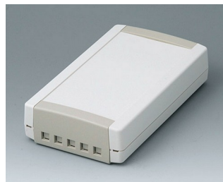
B1075465 TOPTEC 194 F, исп. II АБС (UL 94 HB) белый RAL 9002 194x115x46mm IP 40