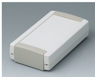
B1055365 TOPTEC 123 F, исп. I АБС (UL 94 HB) белый RAL 9002 123x68x30mm IP 40