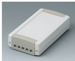
B1055465 TOPTEC 123 F, исп. II АБС (UL 94 HB) белый RAL 9002 123x68x30mm IP 40