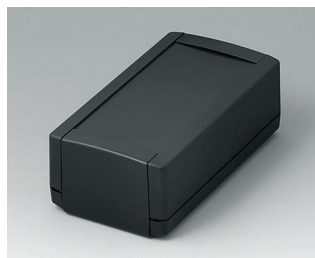
B1060369 TOPTEC 154 H, исп. I АБС (UL 94 HB) черный RAL 9005 154x84x56mm IP 40