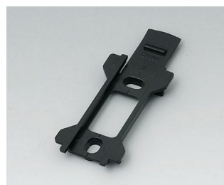
B1340029 Настенный держатель для TOPTEC 102 АБС (UL 94 HB) черный RAL 9005