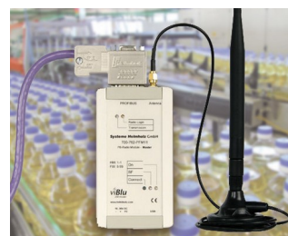
PROFIBUS radio system