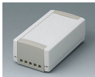
B1050465 TOPTEC 123 H, исп. II АБС (UL 94 HB) белый RAL 9002 123x68x45mm IP 40