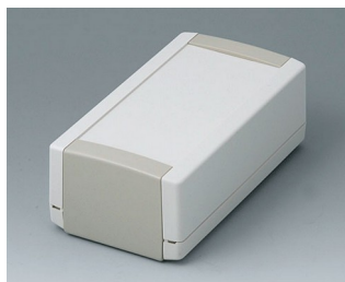
B1060365 TOPTEC 154 H, исп. I АБС (UL 94 HB) белый RAL 9002 154x84x56mm IP 40