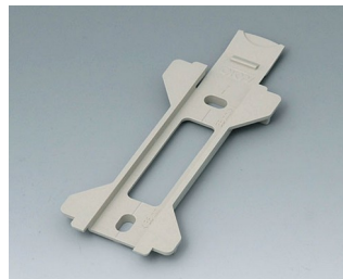
B1360028 Настенный держатель для TOPTEC 154 ПК+АБС (UL 94 V-0) тепло-серый RAL 7032