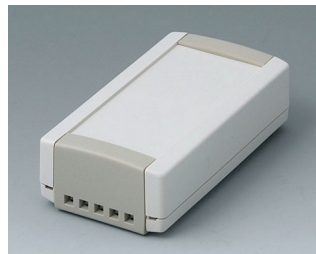
B1040465 TOPTEC 102, исп. II АБС (UL 94 HB) белый RAL 9002 102x54x30mm IP 40