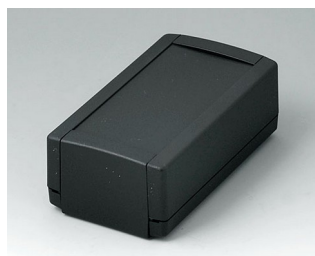
B1050369 TOPTEC 123 H, исп. I АБС (UL 94 HB) черный RAL 9005 123x68x45mm IP 40