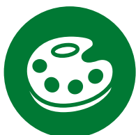
Отливка из нестандартных материалов