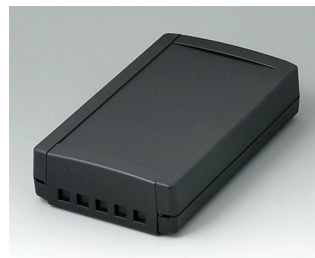
B1075469 TOPTEC 194 F, исп. II АБС (UL 94 HB) черный RAL 9005 194x115x46mm IP 40