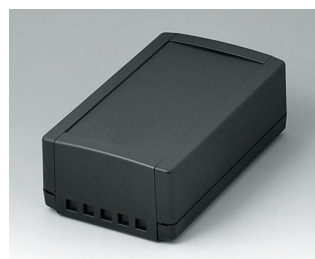
B1070469 TOPTEC 194 H, исп. II АБС (UL 94 HB) черный RAL 9005 194x115x68mm IP 40