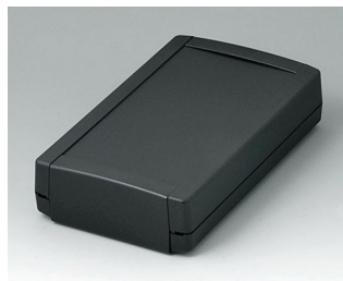
B1075369 TOPTEC 194 F, исп. I АБС (UL 94 HB) черный RAL 9005 194x115x46mm IP 40