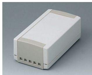
B1060465 TOPTEC 154 H, исп. II АБС (UL 94 HB) белый RAL 9002 154x84x56mm IP 40