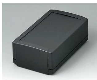
B1070369 TOPTEC 194 H, исп. I АБС (UL 94 HB) черный RAL 9005 194x115x68mm IP 40