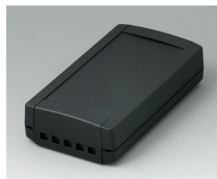
B1065469 TOPTEC 154 F, исп. II АБС (UL 94 HB) черный RAL 9005 154x84x38mm IP 40