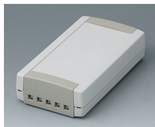
B1065465 TOPTEC 154 F, исп. II АБС (UL 94 HB) белый RAL 9002 154x84x38mm IP 40