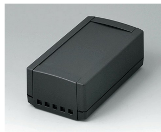
B1060469 TOPTEC 154 H, исп. II АБС (UL 94 HB) черный RAL 9005 154x84x56mm IP 40