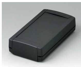
B1065369 TOPTEC 154 F, исп. I АБС (UL 94 HB) черный RAL 9005 154x84x38mm IP 40